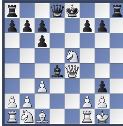
Mat d'Anderssen en 1851