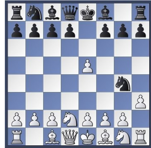
Piège / Gain matériel