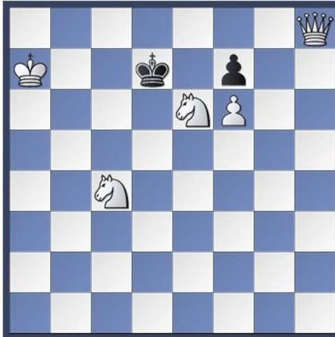
Attraction / Mat en 2